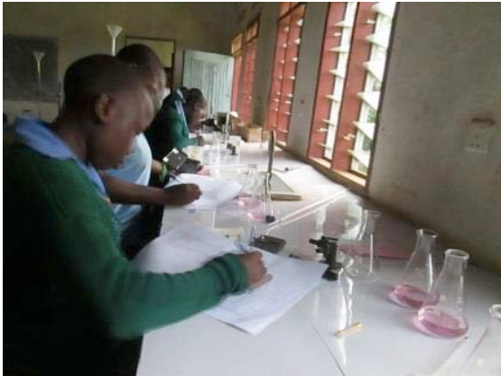
Students in a science practical lesson