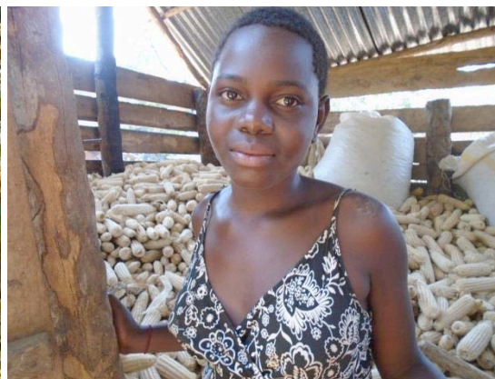
A student stands in front of the family's maize crib