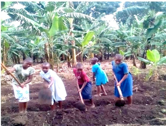
Pupils introduced to school farm lessons