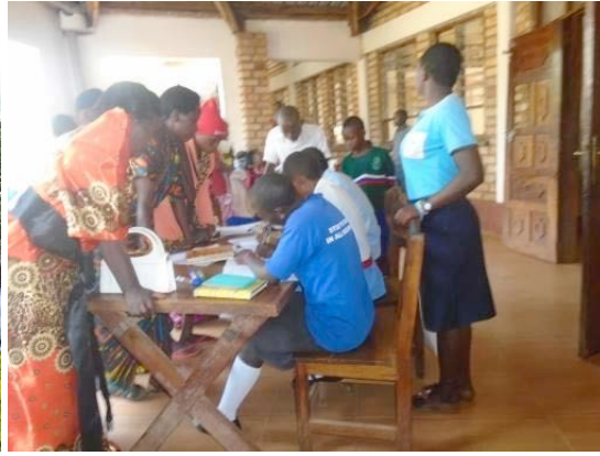
Parents register on arrival for parents' workshop