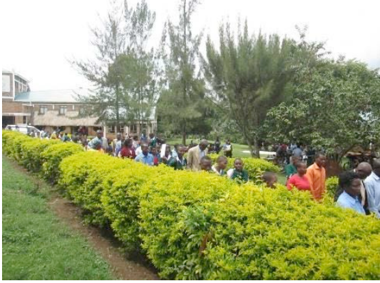
Parents heading to classes for the workshop