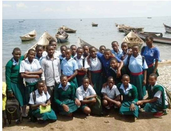
Students at a study tour