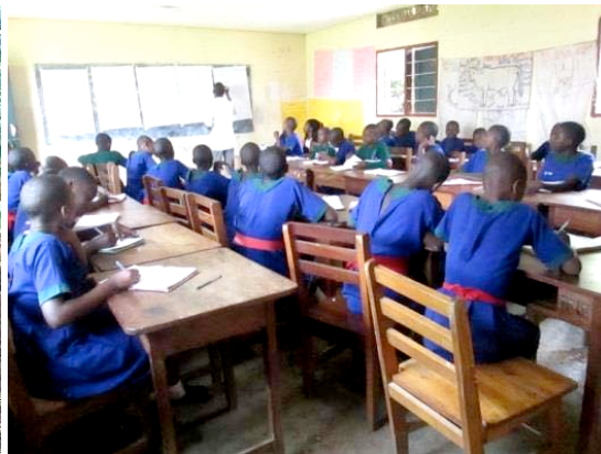
Students in a workshop during the SLW