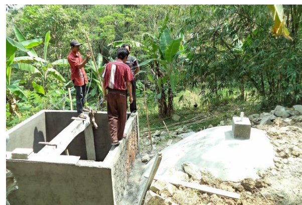
Foto: Uitleg van één van de deelnemers aan het project aan de leerlingen