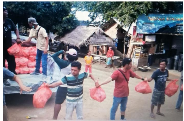
Foto: Dozen met o.a. mie, olie, kookgerei Foto: Het verdelen van de hulpgoederen