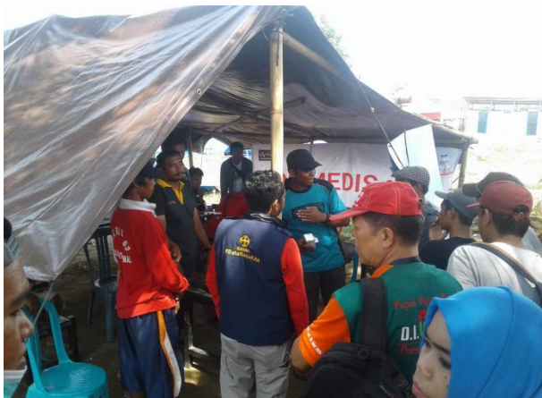
Foto: De medische post is opgezet

Hieronder enkele foto's van de activiteiten van de vrijwilligers van het bovengenoemde bisdom: