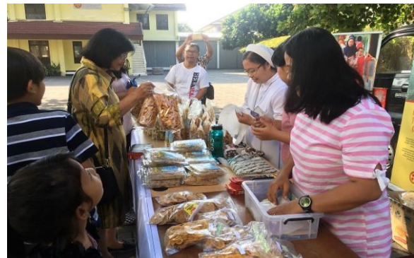
Foto: De gebakken bladeren van Moringa / Kelorboom worden voor de verkoop goed verpakt