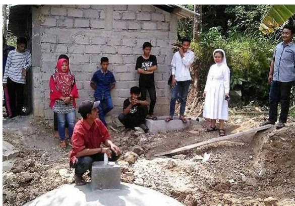
Foto: Leerlingen bij het bezoek aan het biogasproject

Zoals u in eerdere nieuwsbrieven heeft kunnen lezen, ontvangt een aantal ouders van ondersteunde leerlingen financiële hulp bij de aanleg van biogasinstallaties: