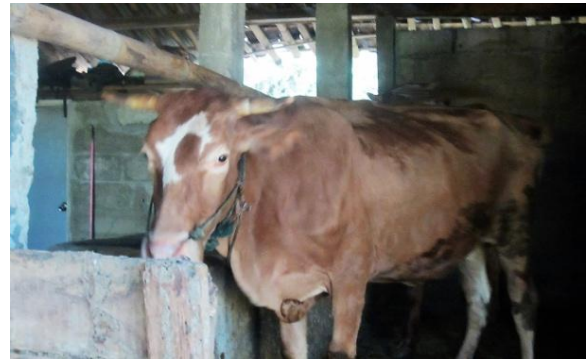
Foto's hieroven: De koeien die de benodigde grondstof mest leveren zijn aangekocht met steun van Stichting Micara