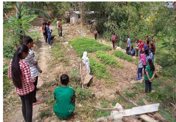
Foto: Leerlingen bij verbouw van groenten, die bemest worden met meststof, verkregen als restproduct na het aftappen van het gas