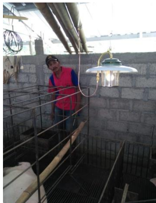
Biogas is ook goed te gebruiken voor de verlichting