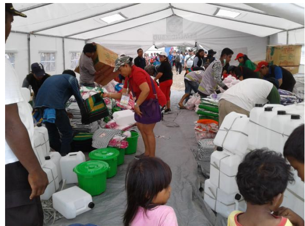
Foto: Tent met hulpgoederen zoals rijst, water, kookgerei, dekens..