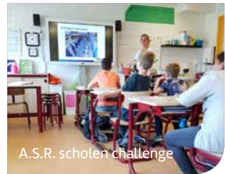
A.S.R. scholen challenge