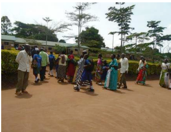
Ouders bezoeken de school voor workshops