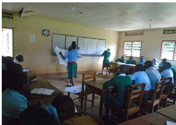
Een klas in actie