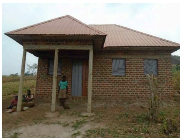
En nogmaals voor het nieuwe huis