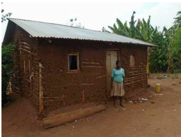
Abitekaniza D. S1 voor het oude huis