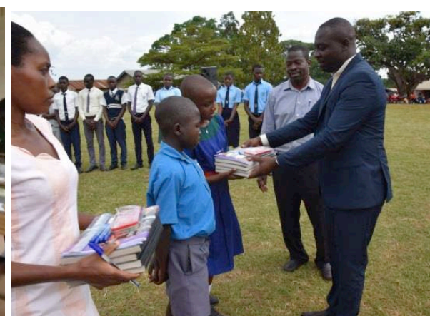
RDC Kibaale reikt prijzen uit voor de beste studenten van een debat over vrede