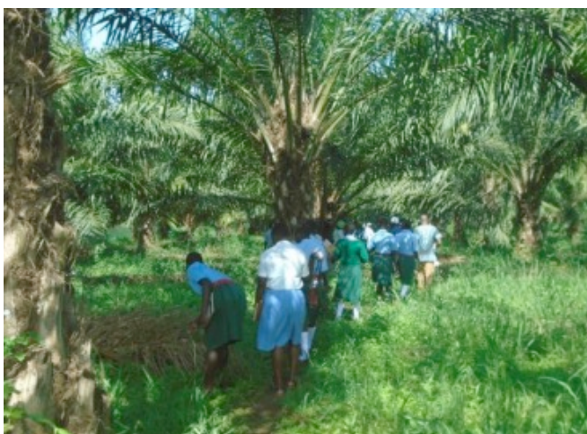
Studenten bezoeken een palmolieplantage