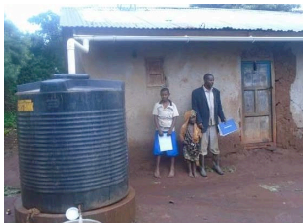
Opslag van regenwater in tanks