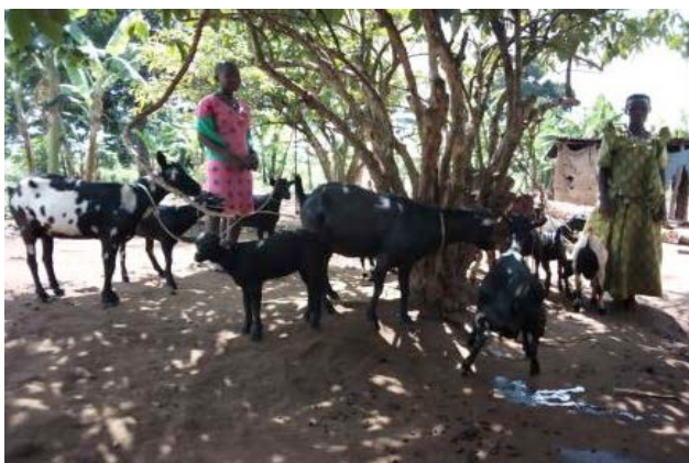
Atugonze I. S3 met haar moeder en de familiegeiten