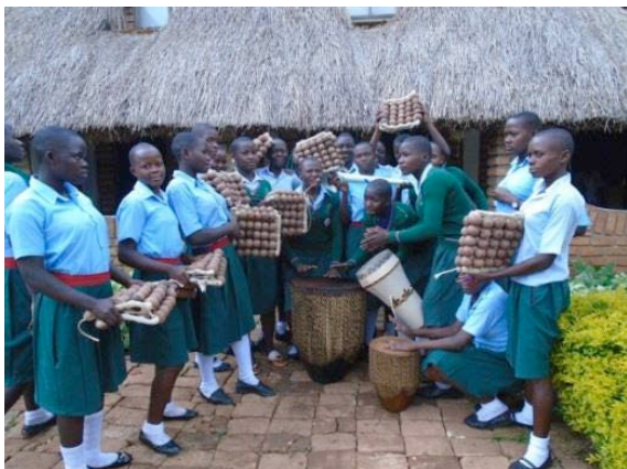
Studenten krijgen nieuwe muziekinstrumenten