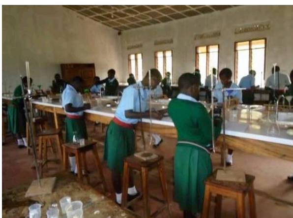
Studenten aan het werk tijdens een practicum