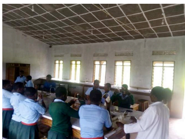
Practicum in het scheikunde lokaal