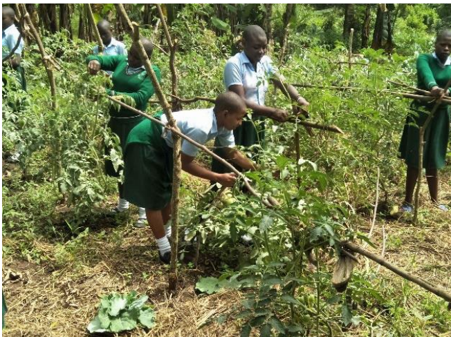
5: Studenten in de Tomatentuin