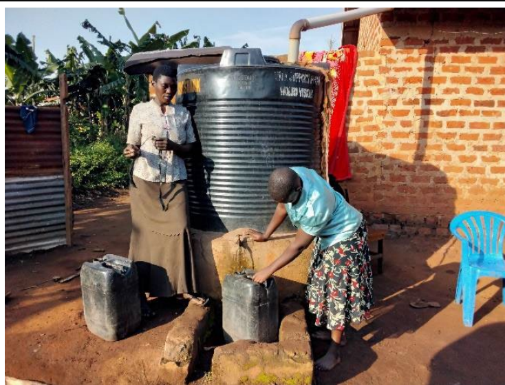
13: Een watertank zorgt voor veilig drinkwater

De leerlingen en hun ouders doen mee aan verschillende projecten geïnitieerd door de URDT, allemaal gericht op verbetering van de kwaliteit van leven. Verbeteringen aan het huis, schoner drinkwater, meer opbrengst van hun land, een betere hygiëne door het bouwen van latrines en een goede gezondheid zijn allemaal doelen die onderdeel vormen van het plan van de school met de families van hun studenten. De school stelt daarvoor Community Development Officers aan, die elk zo'n 10 families begeleiden. Het inkomen van de families stijgt gestaag gedurende de tijd dat zij met hun dochter deelnemen aan het programma van de URDT. Alle families hebben tenminste 2 maaltijden per dag. Zonnepanelen zorgen over het algemeen voor voldoende elektriciteit.