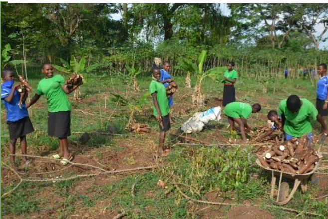
3: Het oogsten van Cassave