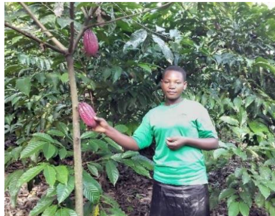
4: Een trotse leerling bij een cacaostruik