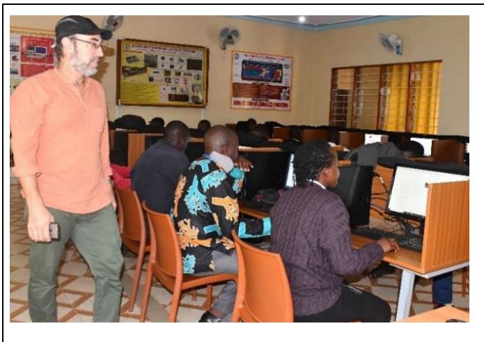
2: ICT workshops voor het lerarenteam door Professors without Borders

De ICT-vaardigheden van de school zijn verder ontwikkeld. Vrijwel alle leerlingen hebben een tablet zodat in geval van verplichte schoolsluiting (bijv. door de corona-pandemie) de lessen via het internet vervolgd kunnen worden. Natuurlijk hoort hier een uitgebreide training bij, zowel van de leerlingen als het onderwijzend personeel. Alle 36 leden van het onderwijzend personeel ontvingen hiervoor o.a. training van "Professors without Borders"..