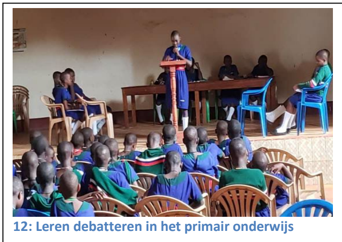
12: Leren debatteren in het primair onderwijs

Debatteren: Al vanaf het lager onderwijs leren de kinderen debatteren. Je verdiepen in een onderwerp en dan een stelling bespreken: argumenten vinden voor en tegen, gebaseerd op feiten en onderzoek. Zo leren de kinderen meer zelfvertrouwen krijgen en leren ze en passant een mening vormen over allerlei maatschappij gerelateerde onderwerpen.