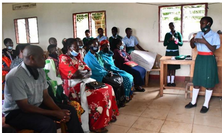
7: Ouders krijgen les van hun dochters

Een belangrijke pijler van de URDT meisjes school is het onderwijs door de studentes aan hun families. Daartoe worden regelmatig op school workshops georganiseerd, die goed worden bezocht door de families.