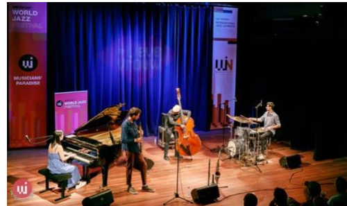
Chi Quartet (NL) Amersfoort World Jazz Festival