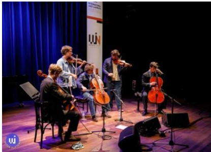
Woodcraft (NL) Dutch Jazz Competition